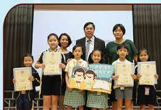
▲ 《閱讀約章》表現優異學生