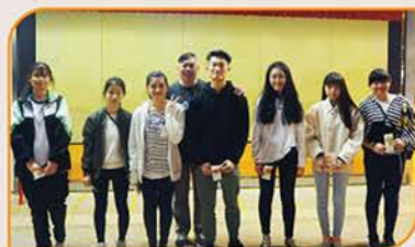
▲ 恭喜各位得獎的舊生。