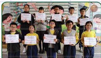
▲ 環亞大杯國際數學邀請賽(一、二等獎)(五、六年級)