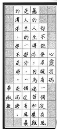
▲ 蔣楊洋 6A