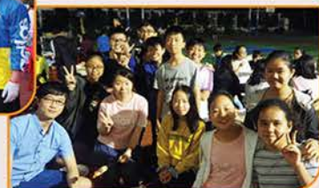
▲ 同學們、老師們的歡聚時刻！