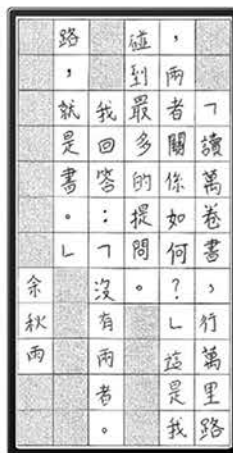
▲ 羅業勤 4C