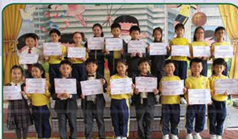
▲ 環亞大杯國際數學邀請賽(三等獎)(二至四年級)