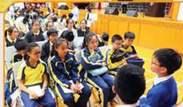
▲ 感謝各位畢業生騰出他們寶貴的時間，給予學弟學妹寶貴的升中資訊！