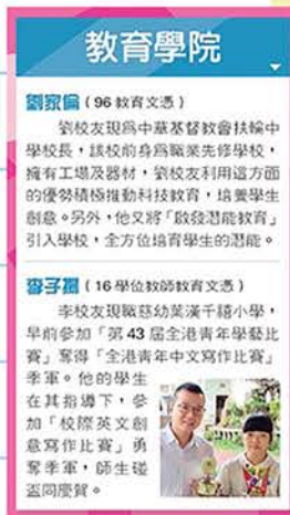
▲ 得獎消息已刊登2018年12月第96期《中大校友》