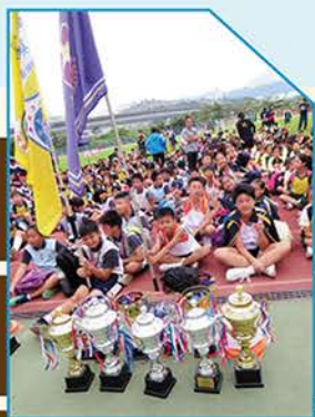
▲ 今年學生表現相當出色