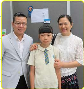
▲ 教師、學生和家長攝於上環文娛中心

相關消息亦已刊登於2018年12月第96期《中大校友》(P.39)和2018年12月第96期《嶺大校友》(P.17)。