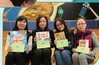
▲ 家長義工為圖書館添運新圖書