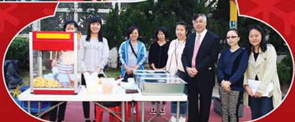
▲ 區校長和義工們一同合照。