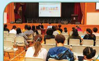
▲ E悅讀學校計劃親子閱讀工作坊

本校於本學年開始參與由香港教育城提供的E悅讀學校計劃，該電子閱讀平台有約500本電子書，讓學生閱讀。在2018年11月，全體老師參與有關E悅讀的教師工作坊；在2018年12月，圖書組亦與資訊科技組合作，為家長舉行了三場E悅讀親子閱讀工作坊，讓家長及學生一同認識如何使用此閱讀平台，為各科組推動電子閱讀作準備。