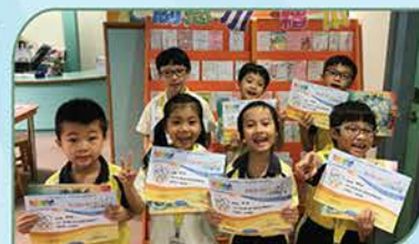
▲ 參與由宗教教育中心主辦的「東亞銀行親子閱讀證書獎勵計劃」學生，可獲證書及禮物作鼓勵