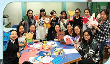
▲ 安徒生會故事家長工作坊，邀請專業人士教授家長講故事的技巧。

經過訓練後，各故事家長獲益良多，也令他們更有信心向學生分享故事。感謝各位故事家長積極參與和預備，讓更多學生聽到不同的故事，享受到閱讀的樂趣。