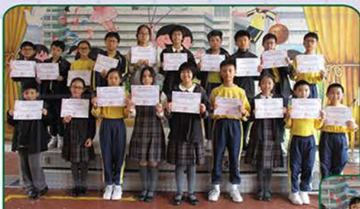
▲ 環亞大杯國際數學邀請賽(三等獎)(五、六年級)

記得在五年級的時候，我開始參加「魔力橋」的訓練和比賽，而第一次參賽是未能取得獎項。後來，吸取了失敗的經驗，以及經過多次的訓練，讓我開始掌握「魔力橋」的技巧。在這些比賽中，我也學會了團體精神，感受到隊友支持的重要！我要感謝老師的指導、家人和隊友的支持，以及天主的庇護。