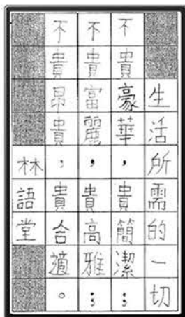
▲ 許卓謙 2A