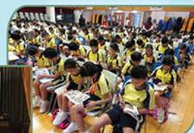
▲ 學生於禮堂進行第一次喜閱時光

由上學年開始，學生可利用剪輯影片的流動應用程式(SPARK VIDEO)，將圖書推介錄製成影片，上載YOUTUBE後，透過學校《每日一訊》向全校學生分享。不少學生觀看了同學們的圖書推介影片後，他們會主動到圖書館借閱被推介的圖書，甚至會要求拍片分享自己喜愛的圖書。同學及家長亦可透過本校網頁及於圖書內頁二維條碼(QR CODE)，觀看同學對該書的推介影片。