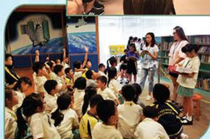
▲ 完成工作坊後，故事家長向學生分享故事