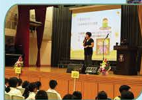
▲ 圖書館主任簡介喜閱時光活動內容