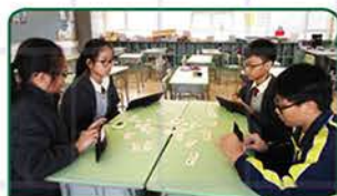
▲ 學生投入玩「魔力橋」的情況