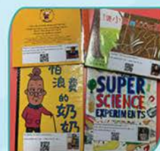
▲ 學生錄製的圖書推介影片張貼在圖書封面以作分享