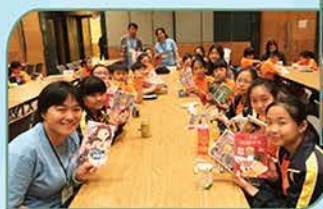
▲ 參與教聯會主辦「我們一起悅讀的日子」活動