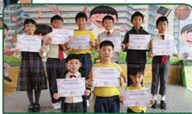
▲ 環亞大杯國際數學邀請賽(二等獎)(二至四年級)