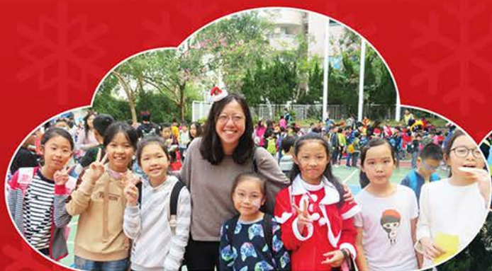
▲ 你看看我們多興奮！