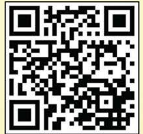
▲ 掃碼QR CODE 即可觀看《中大校友》網上版

If BCA is indeed so easy, why don't you come and try some?