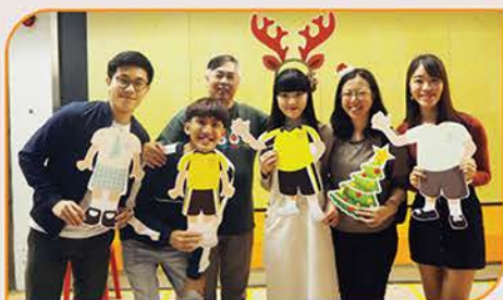
▲ 同學們再次「穿上」小學校服拍照，懷緬一番。