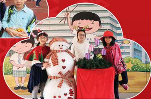
▲ 你們還認得我們是誰嗎？