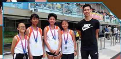
▲ 女甲接力隊跟舊生合照