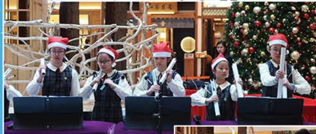
▲各隊音樂校隊的精彩演出