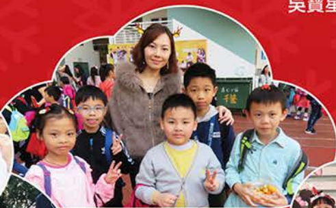
▲ 停一停，一起來拍照。