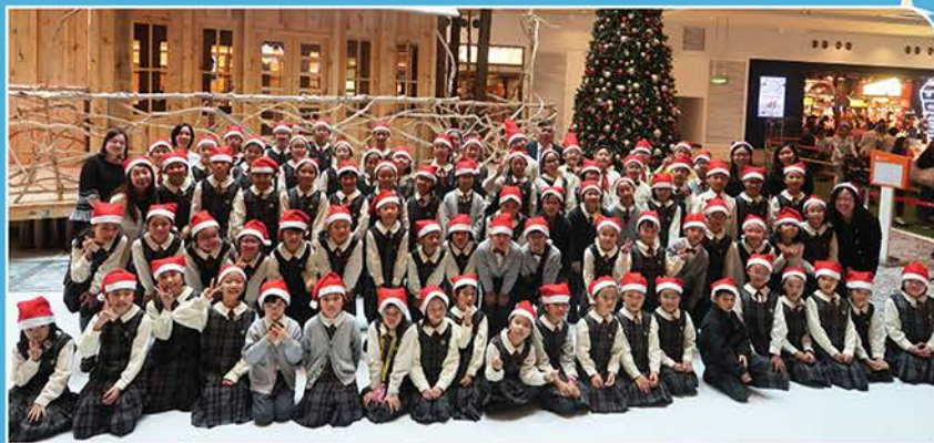
▲來一張全體大合照Yeah!