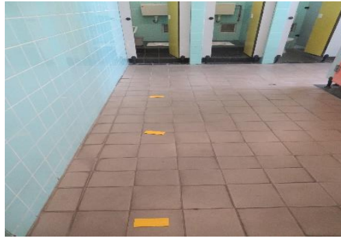
圖(六) 一樓男、女廁排隊指示